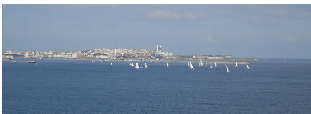
vistas desde el interior de la vivienda