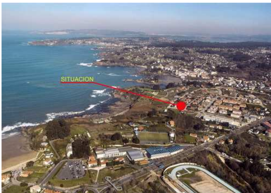
vista aérea; situación

Fotografías de dos últimos chalets individuales de lujo promovidos y construidos por ANPEBA