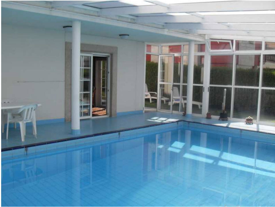
piscina cubierta climatizada mediante paneles solares integrada en la edificación, dotada de duchas con acceso directo

Nueva promoción En curso Calle San Agustín 17, A Coruña. situada a 50 metros de la plaza de MARIA PITA; A Coruña PLAZAS DE GARAJE OPCIONAL