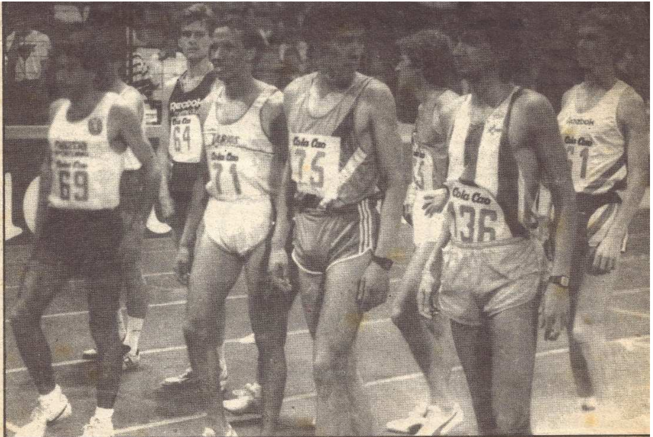
Aouita, tranquilo, en el momento de la salida de la prueba de 5.000 metros, en la que luego se...